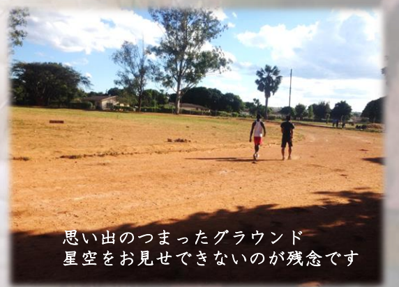
思い出のつまったグラウンド 星空をお見せできないのが残念です

甘党が多いことから想像しやすいと思いますが、日本よりもふくよかな女性(男性も)が多いザンビア。それでも最近、スポーツジムがポピュラーになったりと、ダイエットやエクササイズへの関心が高まっているようです。ママもその内の一人で、健康と美容のためにエクササイズをしています。自宅では動画を見ながらダンスや筋トレ、外では学校のグラウンドでウォーキングとジョギング。私も、たまにグラウンドに参加します。星空の下を歩きながら、仕事の話、家族の話、正しいデート相手の選び方...等々色々な話をします。ボランティア活動や生活で落ち込むことがあっても、歩いた後はすっきり。グラウンドの1週は約400mで、大体10週くらい歩きます。日本のジムのトレッドミルでは「早く終われー」と思っていた4kmですが、ここでは、「一緒に歩くと、あっという間ね」とママも言ってくれる、楽しい時間になります。