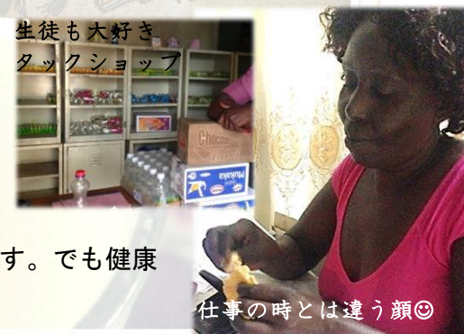
生徒も大好きなタックショップ

因みに、ここザンビアではティータイム（10時頃）に紅茶を飲む習慣があるのですが、甘党が多いザンビアでは、砂糖4～5杯！は当たり前のようです。でも健康志向のママはシュガーフリーOK！日本のおせんべいもお気に入りです。