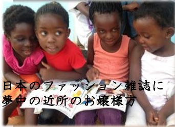
日本のファッション雑誌に夢中の近所のお嬢様方

甘いものにつき、“おしゃれ”も、ザンビアの女性には欠かせないもの。中でも、髪の毛、洋服は特に関心が高い項目です。髪の毛は、編み込みをしたり、ウィッグやエクステンションを付けたりするのが主流です。ヘアスタイルも日本よりバラエティー豊富で、街にはたくさんサロンがあります。