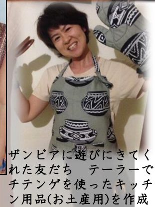
ザンビアに遊びにきてくれた友だち テーラーでチテンゲを使ったキッチン用品(お土産用)を作成