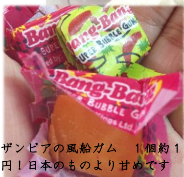
ザンビアの風船ガム 1個約1円！日本のものより甘めです

関西出身で年々おばちゃん化している私にとって、カバンに“飴ちゃん”は当たり前ののですが、ザンビアでも女性（に限らず）は甘いものが大好きです。学校でママとお話したくなった時は、タックショップ（売店）でお菓子を買って、ママが働く建物に会いに行きます。会ったらまずは「I missed you!」と言い合ってから、二人でお菓子を食べながら、どうでもいい会話をします。お菓子はたまにオレンジや洋梨になったりもするのですが、とにかく、甘いものがあると、どうでもいい会話にも花が咲くものなのです。