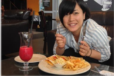
2年間共に頑張った同期隊員

実はママと仲良くなったのは、赴任してから10か月ほど経ってからで、それまでは首都のルサカが好きではなかったと思います。ルサカには近代的なショッピングモールやおしゃれなレストランがあり、任地での生活や活動の大変さを理解してくれるザンビア人の友人や隊員仲間もいて、ストレス発散にはもってこいの場所だったのです。