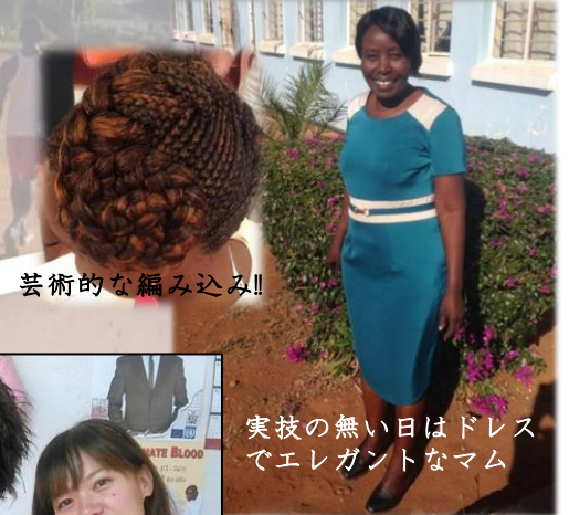
芸術的な編み込み!!

近代的なもの、色々試してみました。できあがって、気に入らない時は、ママに相談して、お直しをします。ママは優しい人ですが、似合わないものは「似合わないわよ！」と私を正しくガイドしてくれる、日本の母と同じくらい頼もしい人でもあります。こうして作ったドレスは、既成服より愛着のあるものばかりです。