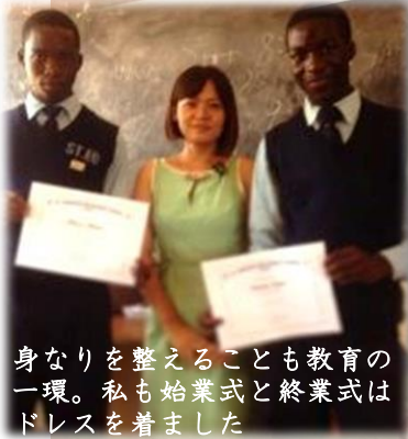
身なりを整えることも教育の一環。私も始業式と終業式はドレスを着ました