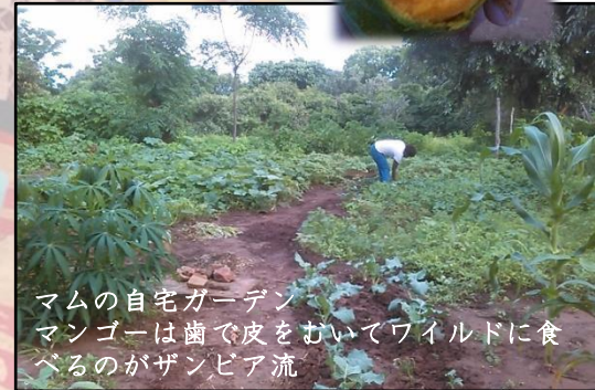
ママの自宅ガーデン マンゴーは歯で皮をむいてワイルドに食べるのがザンビア流