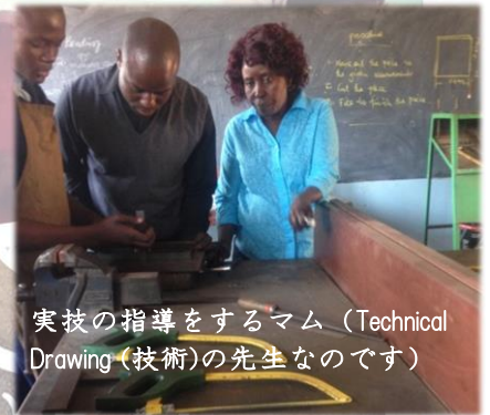
実技の指導をするママ（Technical Drawing（技術）の先生なのです）