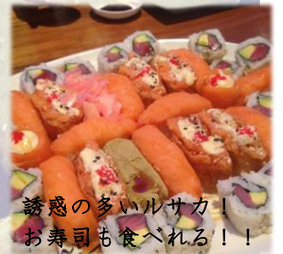
誘惑の多いルサカ！ お寿司も食べれる！！