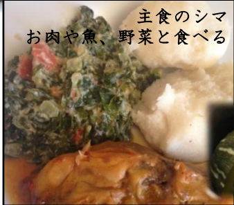
主食のシマ お肉や魚、野菜と食べる